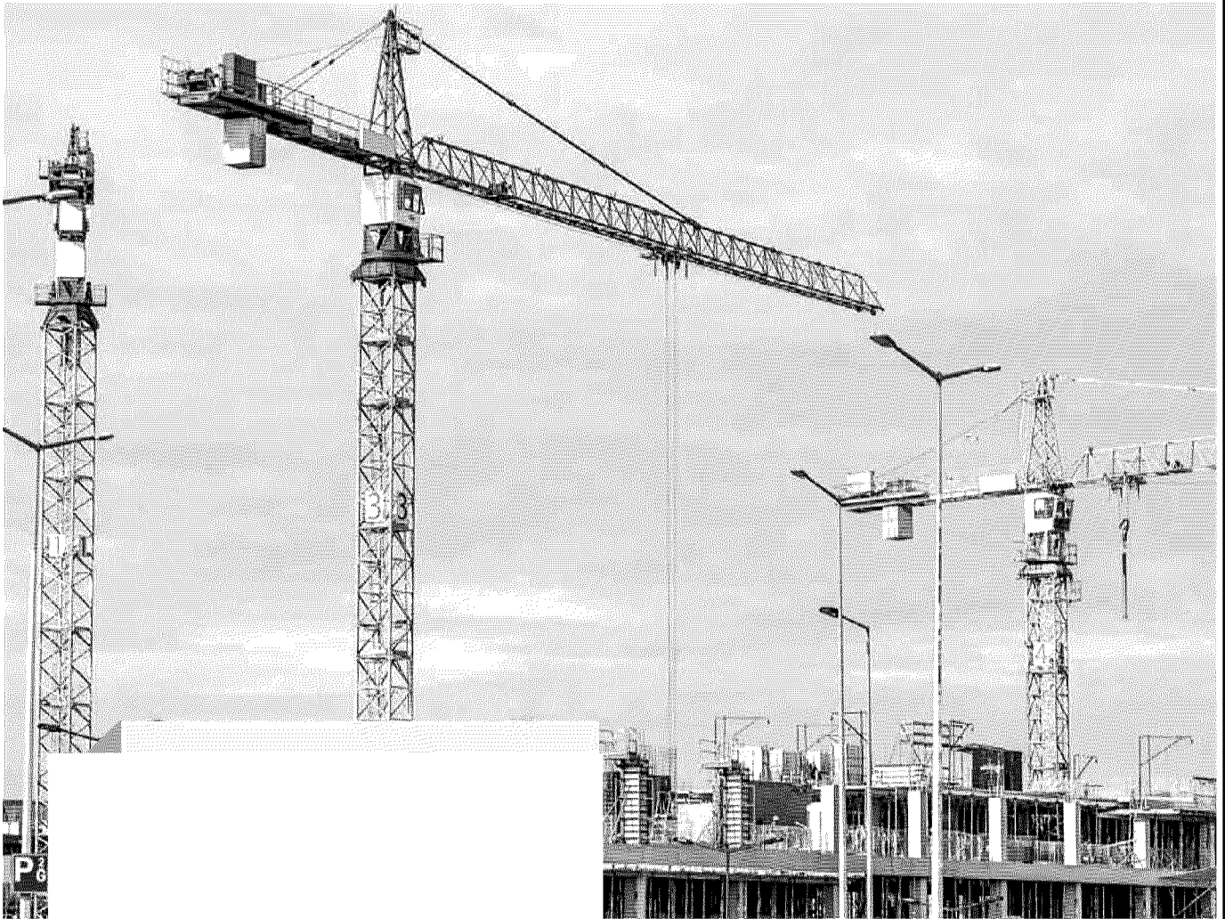
La ripresa dell'edilizia si vede anche a livello nazionale