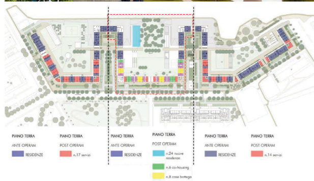
72 In alto: Comparazione ante e post-operam delle facciate del Comparto R5 - Lotta nord In basso a sinistra: Ipotesi di rimodulazione del piano terra con l'inserimento di nuove funzioni