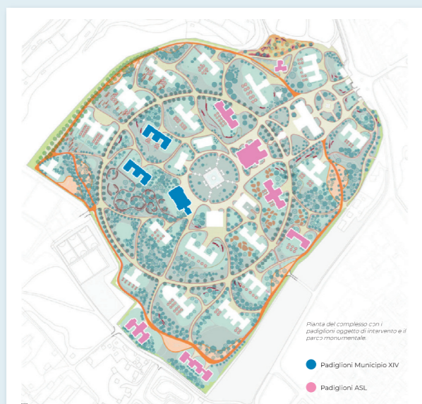
Santa Maria della Pietà