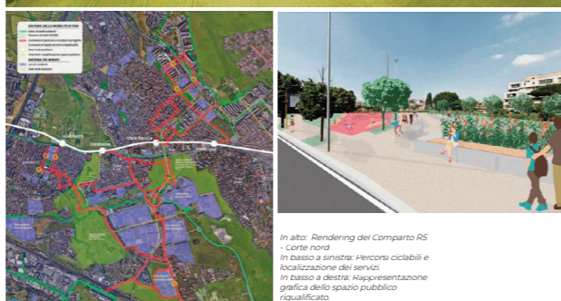
70 In alto: Rendering del Comparto R5 - Lotta nord In basso a sinistra: Percorsi ciclabili e localizzazione dei servizi In basso a destra: Rappresentazione grafica dello spazio pubblico riqualificato