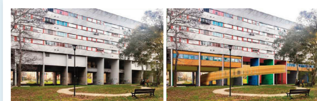
Intervento Franca H - ante e post-operam.

Certo, nell'articolo 11 del nuovo Codice vi sono delle grandi potenzialità che tocca a noi difendere e sfruttare, perché contiene novità che neppure chi si occupa di appalti nella pubblica amministrazione ha colto